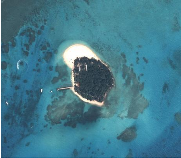
【マニヤガハ島 全景】